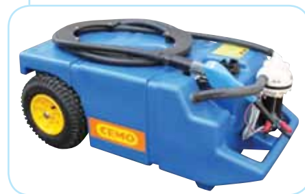
Passages de sangles