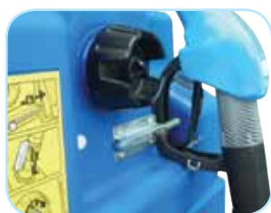
Bouchon avec évent et support pistolet