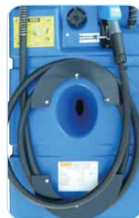
Paroi antiroulis centrale