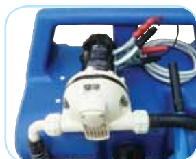
Pompe électrique 12V à membrane